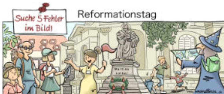
Erdbärenchen, Bigelsen, Martin, Adventskranz, Zauberer