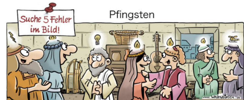
Blitz, Schlitzen, Glöhhirne, Gitarre, Hubschrauber